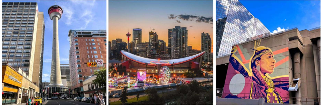
พักค้างคืน ณ Grey Eagle Resort and Casino **** หรือเทียบเท่า

เทศกาลความบอยที่ใหญ่ที่สุดของโลก จัดประจำทุกปีช่วงเดือนกรกฎาคม และเคยเป็นเจ้าภาพจัดการแข่งขันกีฬาโอลิมปิกฤดูหนาวในปีค.ศ. 1988 อีกด้วย (เวลาท้องถิ่นของคัลการีช้ากว่าแวนคูเวอร์ 3 ช.ม. และช้ากว่าไทย 13 ช.ม.)