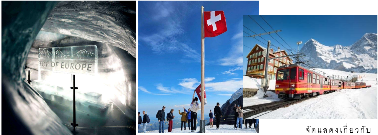
จัดแสดงเกี่ยวกับ

ระลึก จากนั้นนำท่านโดยสารลิฟต์ขึ้นสู่ชั้นบนของอาคารเพื่อเดินออกสู่ “ลานหิมะ” เพื่อชม “ธารน้ำแข็ง Aletsch” ที่ยาวที่สุดในเทือกเขาแอลป์ มีเวลาให้ทุกท่านสนุกสนานบนลานหิมะอย่างเต็มที่ แลชมนิทรรศการที่